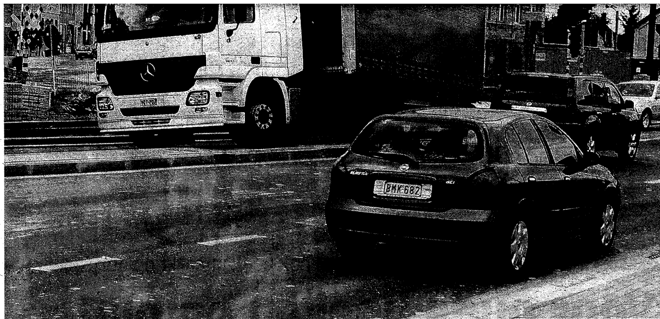
Truckers die de afslag richting Brussel nemen, kunnen het nieuwe kruispunt duidelijk niet aan. Vrachtwagens die, zoals hier, de middenberm nemen zijn eerder regel dan uitzondering.

› Asse Vrachtwagens kunnen draaicirkel niet aan