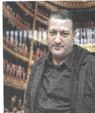
In Brugge fotografeerde Spencer Tunick naakte mensen in het Concertgebouw. ©

De Amerikaanse beeldkunstenaar Spencer Tunick gaat in het weekend van 10 juli aan de slag in het Kasteel van Gaasbeek. Tunick is wereldwijd bekend van zijn naaktfotografie van grote groepen mensen.